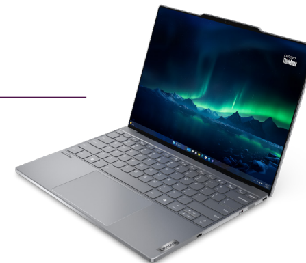
Lenovo ThinkBook 13x AI PC