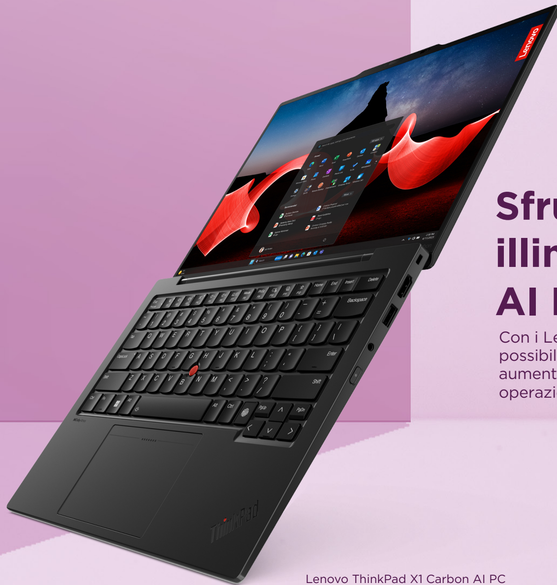
Lenovo ThinkPad X1 Carbon AI PC