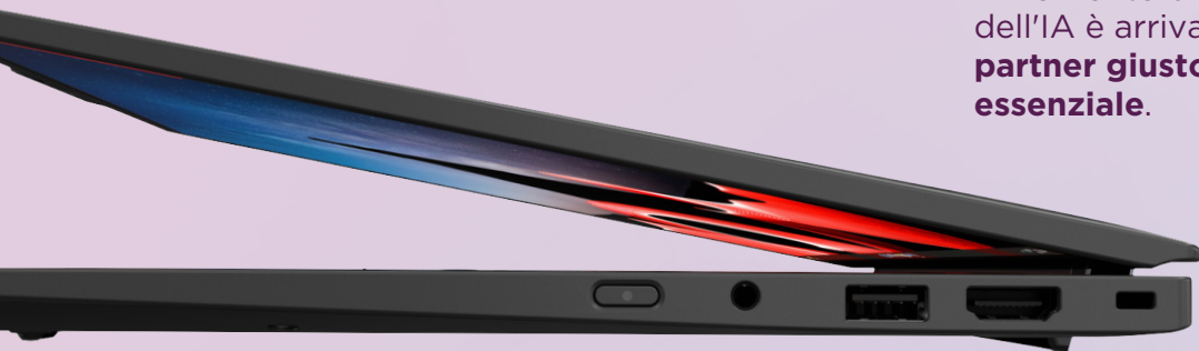
Lenovo ThinkPad X1 Carbon AI PC

Il momento di scoprire il potenziale dell'IA è arrivato, e scegliere il partner giusto per questo viaggio è essenziale.