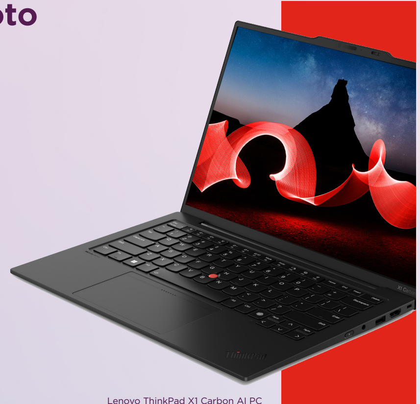
Lenovo ThinkPad X1 Carbon AI PC

Ridurre i costi dei servizi forniti del 20% 12