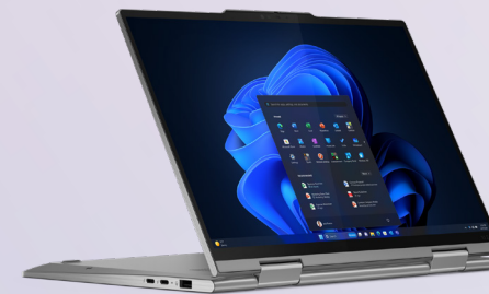
Lenovo ThinkPad X1 2-in-1 AI PC

E i vantaggi della NPU Intel® Core™ Ultra non potranno che crescere nel tempo. Per tutto il 2024, Intel sta lavorando a stretto contatto con oltre 100 fornitori indipendenti di software (ISV) per ottimizzare più di 300 funzioni e applicazioni specifiche per l'AI per i processori Intel® Core™ Ultra.