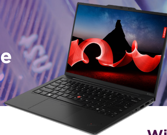
Lenovo ThinkPad X1 Carbon AI PC

Gli upgrade audiovisivi personalizzabili e la perfetta integrazione con gli smartphone mantengono la produttività del tuo team.