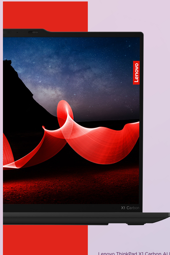
Lenovo ThinkPad X1 Carbon AI PC

Le soluzioni AI di Lenovo migliorano ogni aspetto dell'esperienza lavorativa. Con i Lenovo AI PC, nessuno dovrà più preoccuparsi dell'affidabilità, della sicurezza, della velocità di elaborazione e della durata della batteria - tutti motivi per cui puoi affidarti a Lenovo.