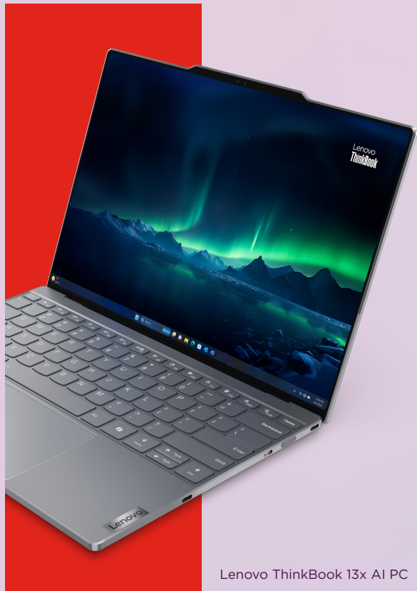
Lenovo ThinkBook 13x AI PC