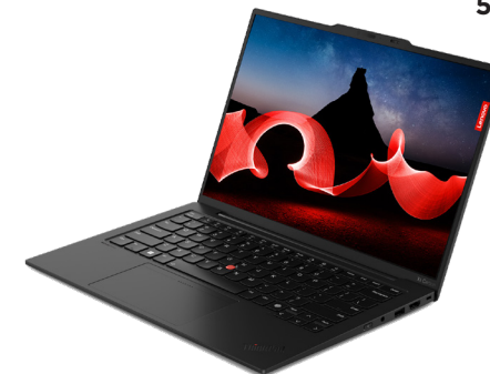
Lenovo ThinkPad X1 Carbon AI PC