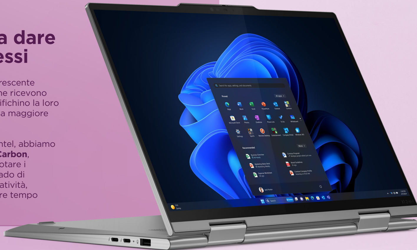
Lenovo ThinkPad X1 2-in-1 AI PC

In stretta collaborazione con Microsoft e Intel, abbiamo progettato i laptop Lenovo ThinkPad X1 Carbon , ThinkPad X1 2-in-1 e ThinkBook 13x per dotare i dipendenti di strumenti basati sull'AI in grado di aumentare la produttività, stimolare la creatività, incoraggiare la collaborazione e risparmiare tempo prezioso.