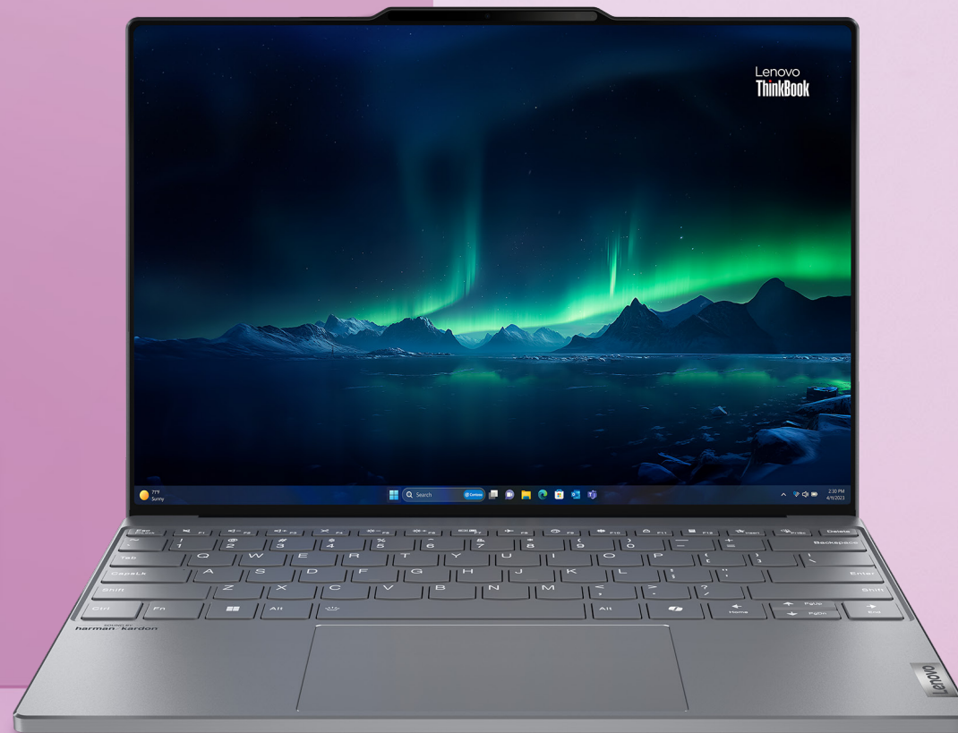
Lenovo ThinkBook 13x AI PC

Con Lenovo, non dovrete scegliere tra una maggiore sicurezza e flussi di lavoro interrotti, tra dare alle persone una tecnologia potente e aggiungere risorse IT, o tra superare la concorrenza e mantenere i costi bassi.