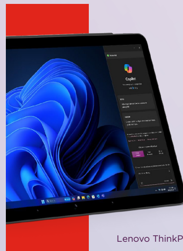
Lenovo ThinkPad X1 2-in-1 AI PC

Grazie a Lenovo ThinkShield , Microsoft Windows 11 Pro e Intel vPro ® che lavorano all'unisono, i Lenovo AI PC sono protetti in profondità, rendendoli meno vulnerabili ai cyberattacchi.