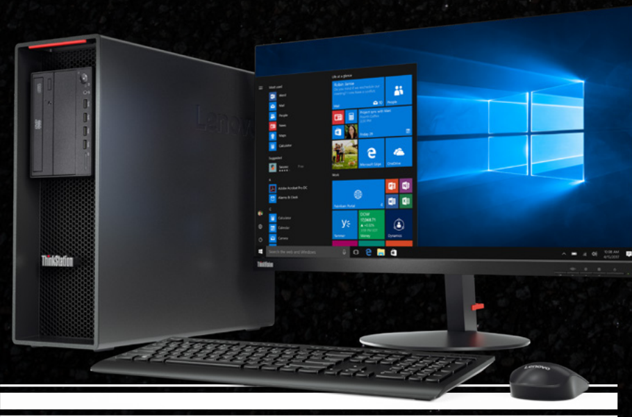
Lenovo ThinkStation P520 con monitor ThinkVision P27q

Gracias a la facilidad de gestión, los controladores actualizados y el sólido rendimiento de las aplicaciones, los usuarios rinden al máximo. Además, toda la gama de workstations de Lenovo cuenta con la certificación ISV para proporcionar un rendimiento óptimo de las aplicaciones críticas y una experiencia de usuario de gran calidad.