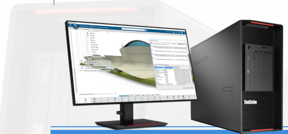
Lenovo ThinkStation P920 con monitor ThinkVision P27q-20